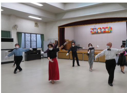
金曜社交ダンスクラブ