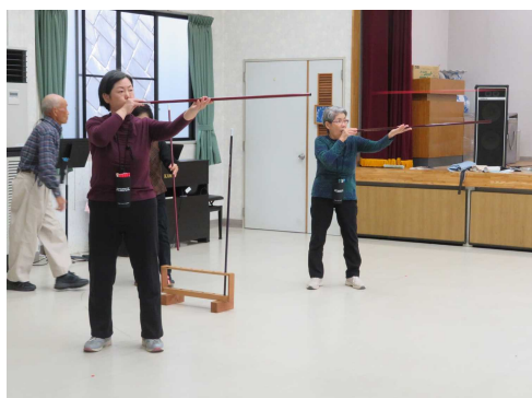
スポーツウエルネス吹矢クラブ