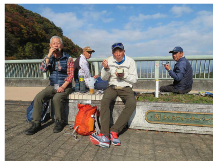
△浦山ダムでランチタイム△