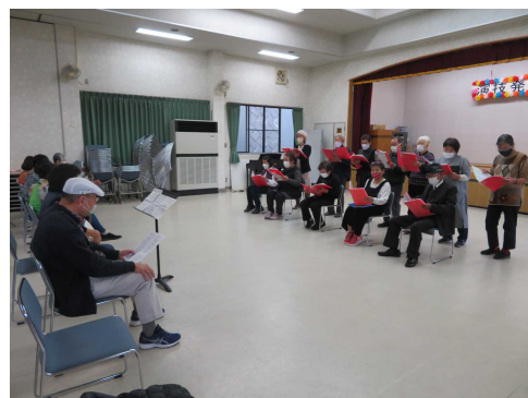
歌声倶楽部「ミューズ」