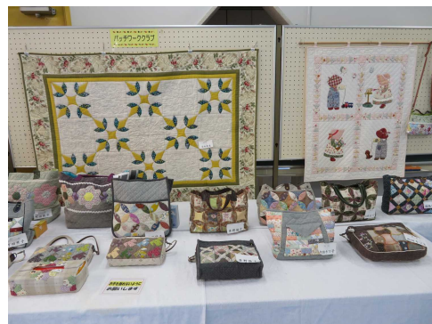
パッチワーククラブ