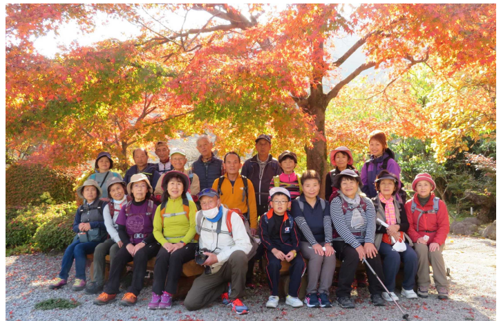
札所29番 長泉院にて